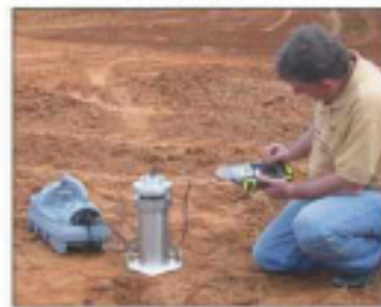
Figure 4. 对现场击实土进行TDR测试。