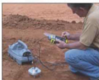
Figure 1. 现场TDR测读。

现场土的电介质常数可由MDI土壤密度仪测定。将现场测试过的土开挖取样，并在现场用击实筒进行击实试验。量测模具和土体的质量，在体积已知的条件下，可确定土体的湿密度。然后用MDI密度仪测定击实筒内土壤的电介质常数。击实筒内土壤的含水量由PDATDR软件根据电介质常数、含水量和干密度之间的相关关系计算得到。该相关关系需要用到两个土壤相关常数。现场土的密度可由软件根据击实筒内土的密度以及现场和击实土的电介质常数算得。