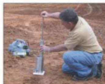
Figure 2. 现场TDR击实筒夯击备样。