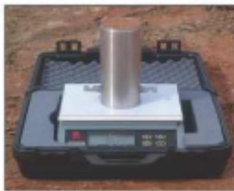
Figure 3. 确定现场土的湿密度。